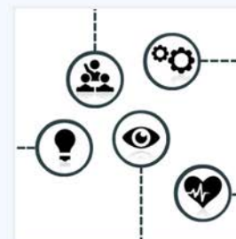
ΠΑΙΔΑΓΟΓΙΚΗ ΑΞΙΟΠΟΙΗΣΗ ΒΙΝΤΕΟ