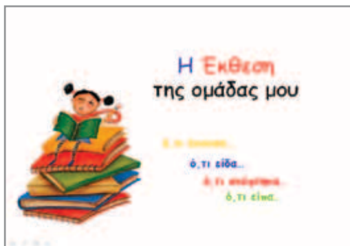
Εικόνα 6: «Η οπτικοακουστική έκθεση της ομάδας μου»

Ο εκπαιδευτικός της τάξης μπορεί να βοηθήσει την όλη ομαδική εργασία. Η απαγγελία ποιημάτων από τους μαθητές (με ηχογράφηση), η ανάλογη μουσική σύνθεση της αρεσκείας των παιδιών από την προτεινόμενη δισκογραφία, σχετικά έργα τέχνης Ελλήνων και ξένων λογοτεχνών, φωτογραφίες που θα έχουν βρει τα παιδιά στο Διαδίκτυο, προσωπικά κείμενα, κείμενα λογοτεχνών, εννοιολογικοί χάρτες κ.λπ. αποτελούν τα στοιχεία της ψηφιακής παρουσίασης (εικόνα 6).